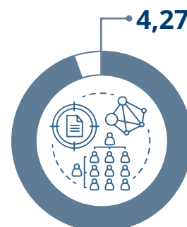
Valutazione organizzazione del corso Scala valore da 1 a 5